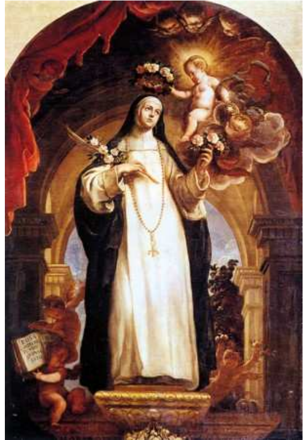
Huile de Claudio Coello (1642-1693), musée du Prado, Madrid

Rose par la prière, le service auprès des plus pauvres, le jeûne et les mortifications, veut laisser s'épanouir en elle les grâces de son baptême pour marcher à la suite du Christ pauvre et souffrant. Son exemple spirituel est sainte Catherine de Sienne qui a médité plus particulièrement sur la Passion du Seigneur. S'il est vrai que Rose choisira de vivre avec l'accord de ses confesseurs de nombreuses mortifications et des jeûnes continus, elle reconnaît toujours que la véritable pénitence c'est d'avoir un cœur plein d'humilité.